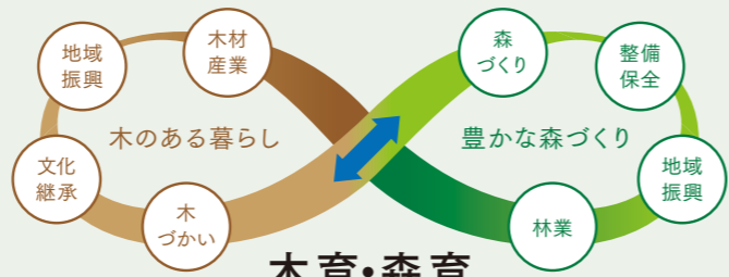
持続可能な森林・林業・社会の実現に向けた木育・森育の役割